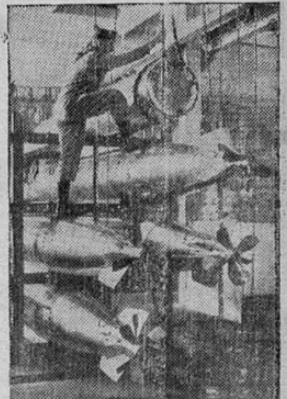
Preparando los torpedos para ser cargados en los submarinos británicos en una de las tantas bases en la Gran Bretaña.