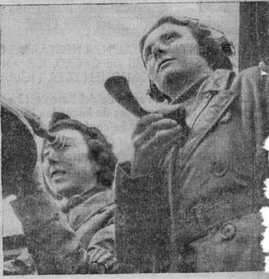
Mujeres británicas en el servicio de observación. Estas dos chicas inglesas están siempre alerta para dar la señal cuando se aproximen los aviones enemigos.