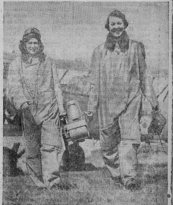
Las mujeres británicas prestan valiosos servicios como fotógrafas militares. En la foto vemos a dos "WRENS" llevando una cámara aérea después de un vuelo de reconocimiento sobre el territorio enemigo.