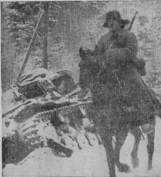
La "senda de la derrota" llaman los rusos al camino que han tomado los alemanes en su precipitada fuga. Un soldado de caballería ruso pasa al lado de un tanque nazi destruido por la artillería soviética.