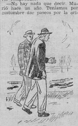
—Está muerta — replicó humildemente. Es decir, eso piensan ellos.

lla del lago todas las noches. Lo hacemos ahora, Margaret y yo. Hizo una pausa y dirigió su mirada hacia algún lugar detrás de mí, hacia el lago. Aquello me hizo pensar que en realidad había alguien más allá. Ella siempre se separa de mí allí... en la punta. No me volví siquiera. No sabía a ciencia cierta si lo que sentía dentro de mí era un profundo temor. — Pero usted ha tratado de explicarle esto a... sus vecinos, — le pregunté. Hizo un gesto de apatía. Se reirían. Algunos me cogerán lástima. Me llamarán loco y me echarán a un lado. Aún usted mismo piensa que me pasa algo raro. Y no obstante, usted también camina solo, y no siente nada extraño. Para este argumento no pude encontrar respuesta. Sabía que éramos diferentes. Su soledad y la mía eran distintas. El vivía en un mundo que estaba más a-