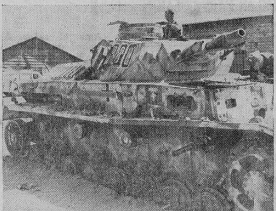
Uno de los muchos tanques del Eje que no volverá a molestar a los británicos. Este tanque del Afrika Korps, de Rommel ahora espera la inspección de los ingenieros del 8º Ejército.