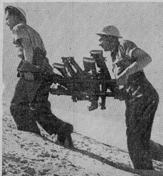
Los armeros británicos en Libia, no carecen de trabajo en la reparación y cuidado del armamento británico. He aquí a dos de estos expertos llevando rifles a su taller.

Dirección Postal: Apartado 449 — Limón NO OLVIDE QUE LOS EXITOS COMERCIALES DEPENDEN DEL FUNCIONARIO.