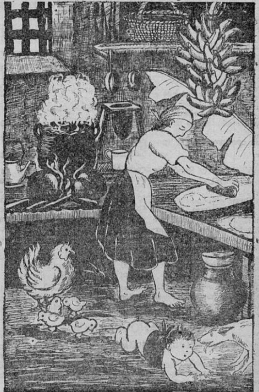
LA COCINA TIPICA COSTARRICENSE, DONDE SE SAZONAN LAS MAS EXQUISITAS VIANDAS

Entre los licores nacionales uno de los que cuenta con más aceptación es el RON CAÑERO, el fino ron popular para tomarlo puro o con agua mineral.