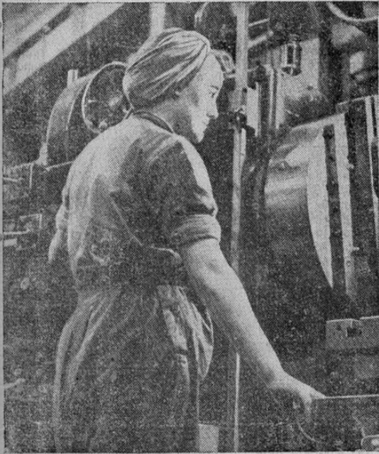
Una de las cinco millones de mujeres británicas que cooperan en el esfuerzo bélico de la Gran Bretaña.